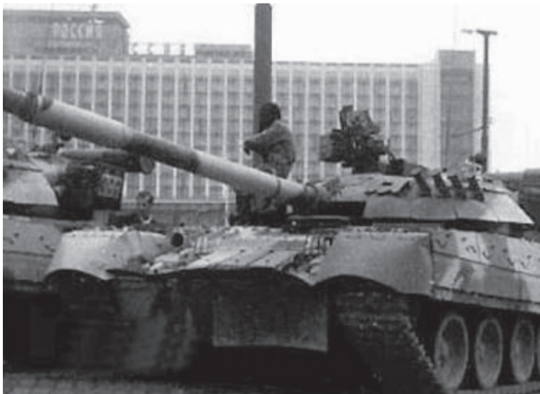
Август 1991 года. Танки на улицах Москвы.

Резюме: контрреволюция в августе 1991 победила и из-за трусости и неспособности тогдашнего партийного руководства взять