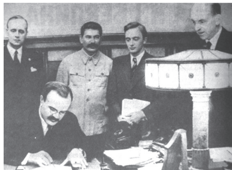
Подписание Договора о ненападении между Германией и Советским Союзом (Пакт Молотова-Риббентропа). Москва, 23 августа 1939 г.

В 2009 году исполняется 70 лет со дня заключения советско-германского договора о ненападении 23 августа 1939 года.