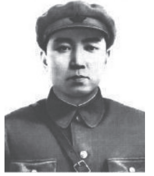
Ким Ир Сен в период создания АНПА

15 августа в Корейской Народно-Демократической Республике отмечается День возрождения Родины. В этот день 64 года назад части Корейской Народно-Революционной Армии, возглавляемые товарищем Ким Ир Сеном, при поддержке соединенной 25-й армии Советских Вооруженных Сил и морских десантов Тихоокеанского флота освободили территорию Северной Кореи от японских захватчиков.