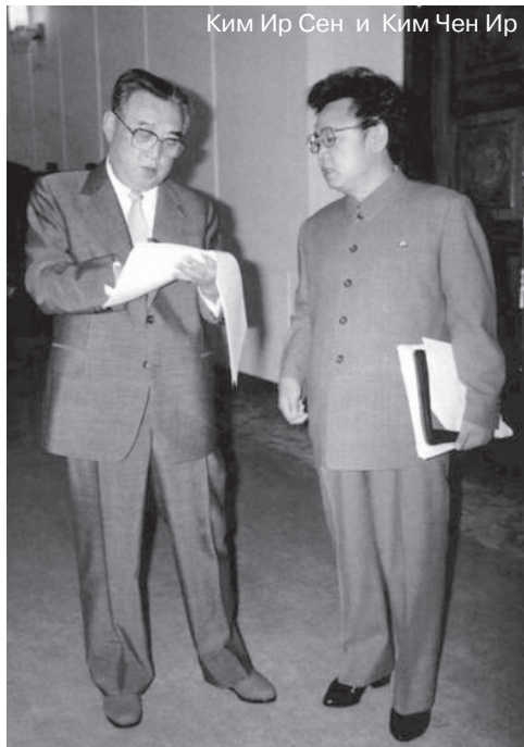
Ким Ир Сен и Ким Чен Ир

В апреле в КНДР отмечается несколько государственных праздников.