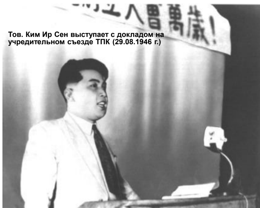
Тов. Ким Ир Сен выступает с докладом на учредительном съезде ТПК (29.08.1946 г.)

10 октября 1945 года, после освобождения Кореи от японского колониального ига (15.08.1945г.), Великим Вождём товарищем Ким Ир Сенем был создан Центральный организационный комитет Коммунистической партии Северной Кореи. На учредительном съезде 26 августа 1946 г. путем объединения, слияния Коммунистической партии и других партий трудящихся была создана Трудовая партия Кореи как единая партия трудящихся.